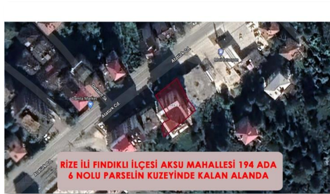
Şekil 3. Çalışma Alanı Parsel Durumu