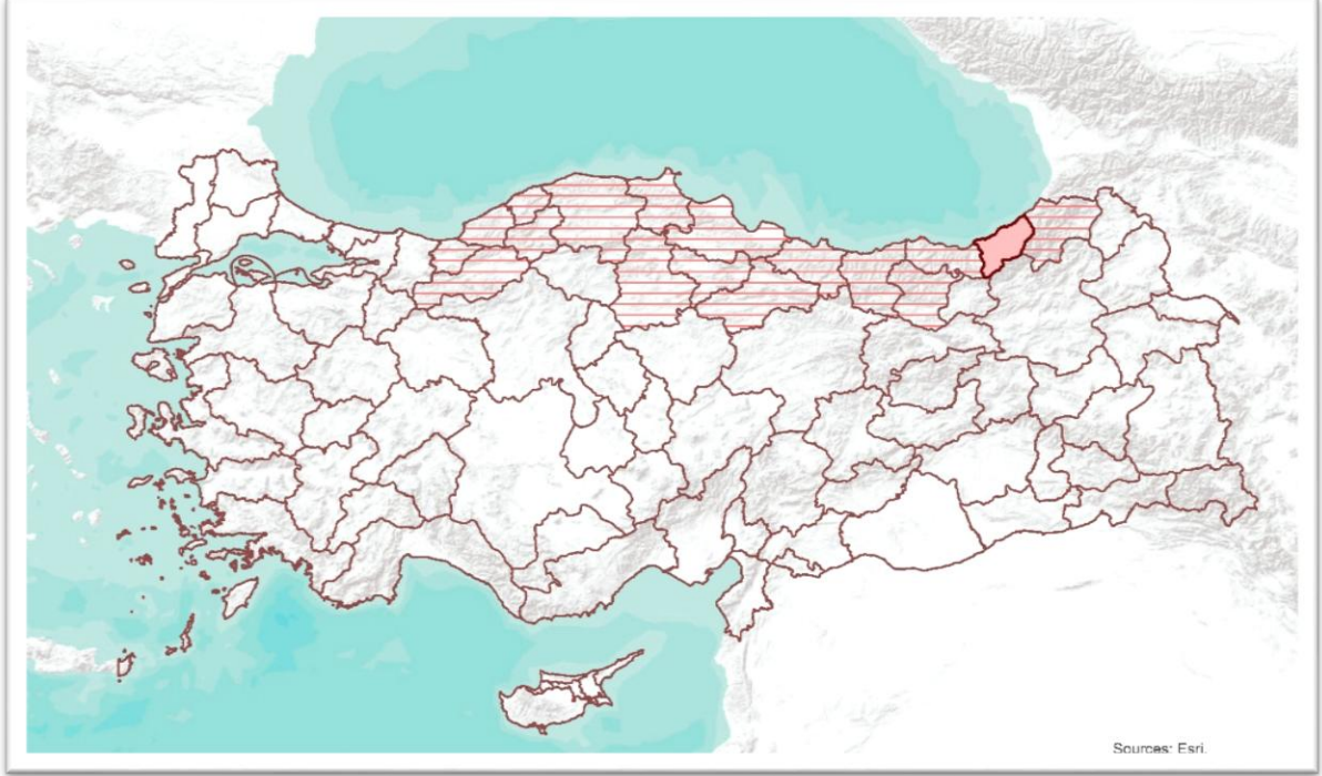
Harita 1: Planlama Alanının Ülkedeki Konumu

İmar planı değişikliğine konu olan alan, Rize ili, Fındıklı ilçesi, Sahil mahallesinde kâin tapunun 358 Ada 4, 5, 6 ve 7 numaralı parselleridir. Parseller, 1/5000 ölçekli nazım imar planının F46-A-23-C paftasında, 1/1000 ölçekli uygulama imar planının F46-A-23-C-1-C paftasında, 427600-427700 yatay ve 4570600-4570700 düşey koordinatları arasında kalmaktadır. Planlama alanına yakın konumda konut alanları yer almaktadır ( Harita 2 ).